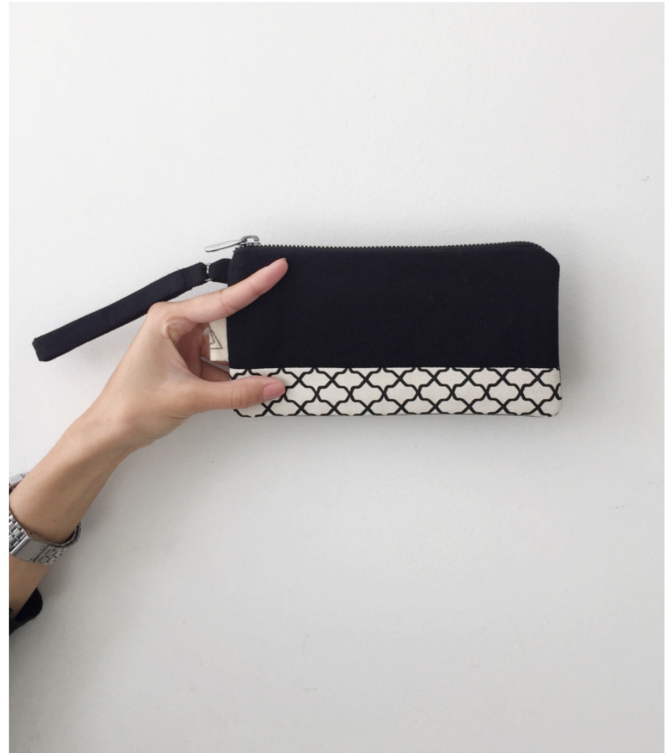
MINIMAL NIGHT P&B