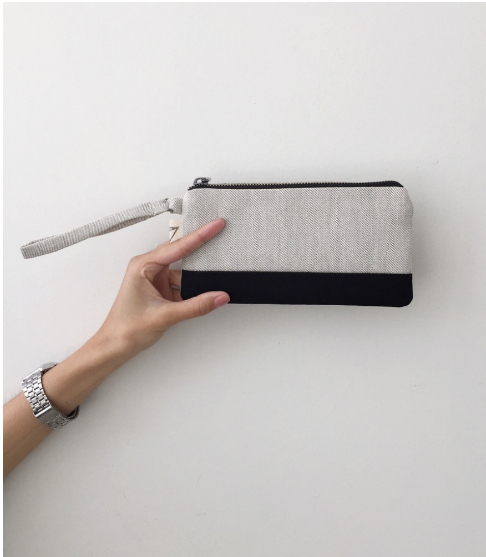
MINIMAL SIDEWALK BLACK