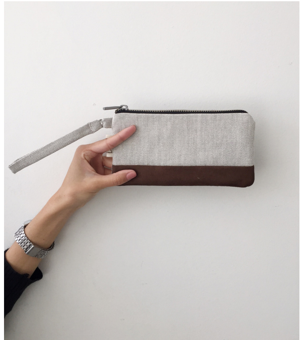
MINIMAL SIDEWALK BROWN

A Uai Soul é uma loja online desde 2013. No ano de 2016, deu seu passo como marca.