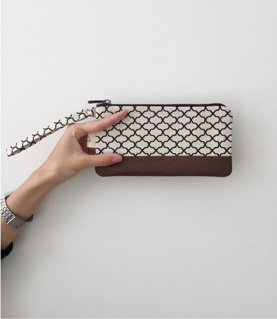
MINIMAL BRICK BROWN